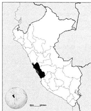
GRÁFICO °01. Macro localización del Proyecto