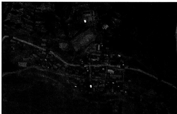
GRÁFICO °02. Micro localización del Proyecto