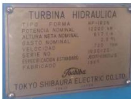
Figura 1. Placa de datos de las turbinas hidráulicas G1 y G2 de C.H. Aricota I