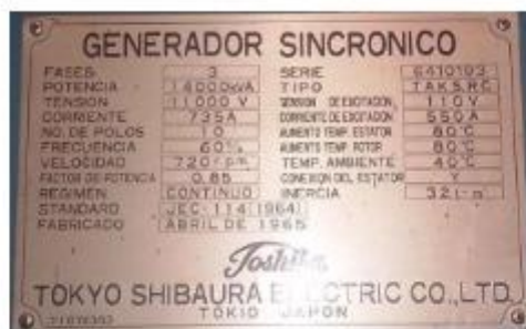
Figura 2. Placa de datos de los generadores G1 y G2 de C.H. Aricota I