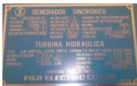
Figura 3. Placa de datos de los Grupo G1 de C.H. Aricota II