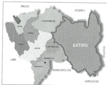
UBICACIÓN GEOGRÁFICA EN EL CONTEXTO REGIONAL DE JUNÍN

GERENCIA DE INFRAESTRUCTURA, DESARROLLO URBANO Y RURAL SUBGERENCIA DE EJECUCIÓN DE OBRAS PÚBLICAS