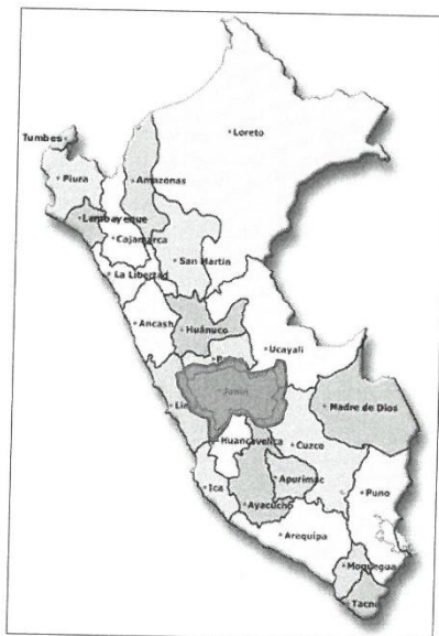
MAPA 01: MACRO LOCALIZACIÓN DEL ESTUDIO