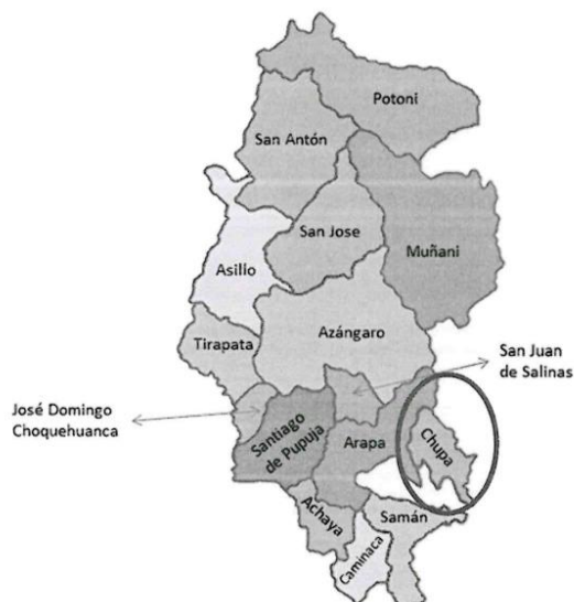
Figura 01. Ubicación del Centro de Salud Chupa

Establecimiento : Centro de Salud Chupa Departamento : Puno Provincia : Azángaro Distrito : Chupa