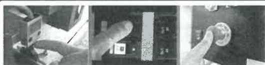
DISPOSITIVOS DE SEGURIDAD