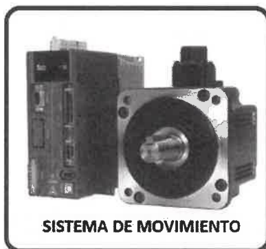
SISTEMA DE MOVIMIENTO