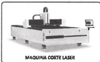
MAQUINA CORTE LASER

Año del Bicentenario, de la consolidación de nuestra Independencia, y de la conmemoración de las heroicas batallas de Junín y Ayacucho