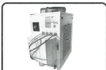
SISTEMA DE ENFRIAMIENTO INDUSTRIAL