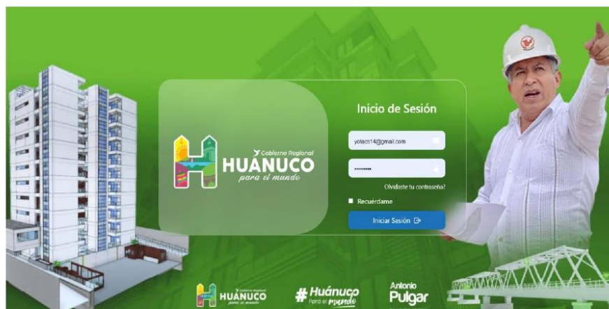
Ingreso a la Plataforma De Evaluación de Expedientes Técnicos del GOREHCO.

Es preciso indicar que la Entidad luego de la capacitación, brindará los accesos correspondientes tanto al proyectista como al Evaluador, donde el Administrador de Contrato verificará el uso correcto y actualizado de la información de acuerdo a la información de los Entregables, por productos, por acciones de control, de evaluación como de pre evaluación, entre otros.