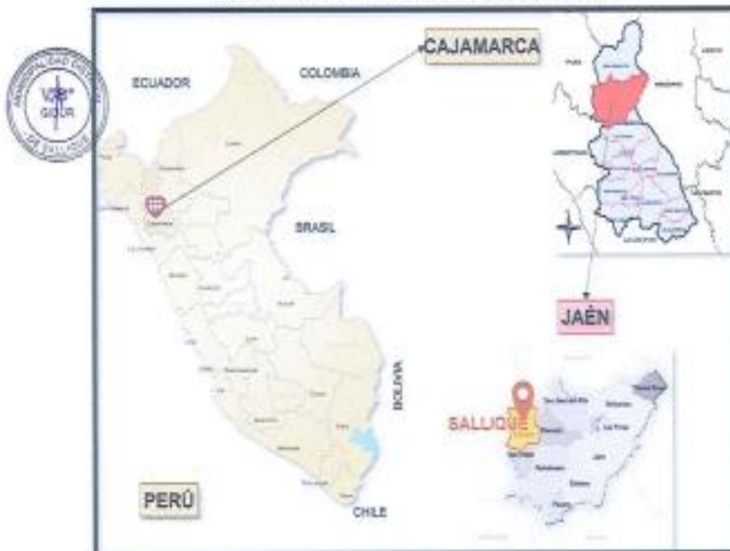
GRAFICO N°01 – LOCALIZACIÓN GRAFICA DEL PROYECTO

REGION : Cajamarca PROVINCIA : Jaén DISTRITO : Sallique LOCALIDAD : Shimana