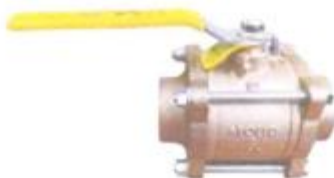
Ilustración 1 imagen referencial

Una vez realizadas las verificaciones se procederán a valorizar el número de unidades para poder así dar la conformidad de los trabajos correspondientes a esta partida.