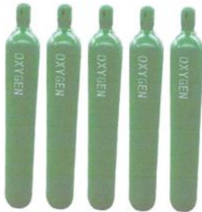
Ilustración 3 imagen referencial

Un carro de transporte ergonómico para balones de oxígeno de 10 m3, el modelo se coordinará con el postor.