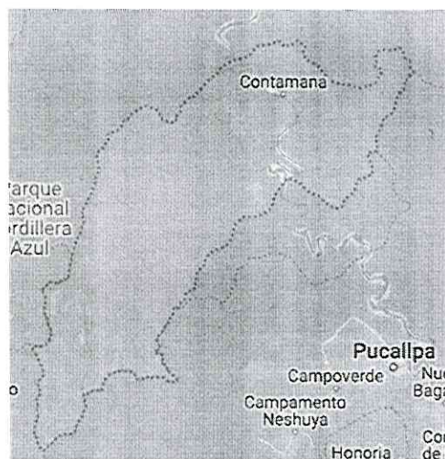
Provincia de Ucayali