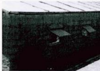
Fotografía referencial de ventana de madera

grueso, desplegable verticalmente, altura de ventana 0.40 m y ancho de ventana de 0.70 m.