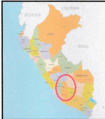
Imagen N°02: Ubicación departamental del proyecto.