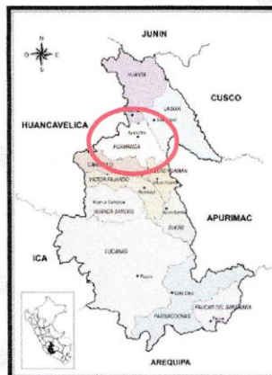
Imagen N°03: Ubicación provincial del proyecto.