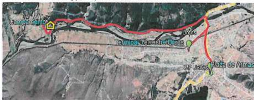
Imagen: Ubicación de la Obra.

La descarga de los gaviones será en el almacén de obra a cuenta del proveedor, el horario de entrega del material se realizará en el horario de 07:00 de la mañana a 04:00 de la tarde de lunes a viernes y los sábados de 07:00 de la mañana hasta las 12:00 m del día, pudiendo ser esta optimizada de acuerdo con las necesidades de la obra y previa aprobación del Residente de Obra.