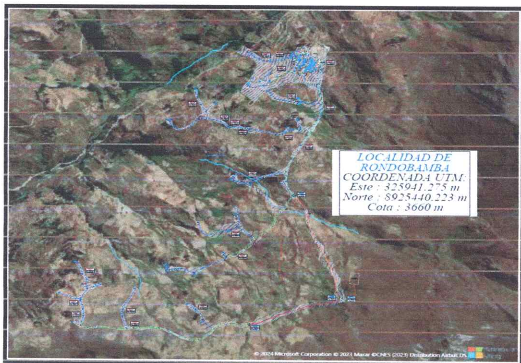
Imagen 2. Localización del proyecto "CC.PP. RONDOBAMBA"