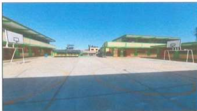
Foto N°01: Vista de la losa multideportiva actualmente de la IE Agropecuario Yaután con falta de una estructura para proteger del sol a los alumnos.

De acuerdo con la inspección in situ, se encontró la situación actual: