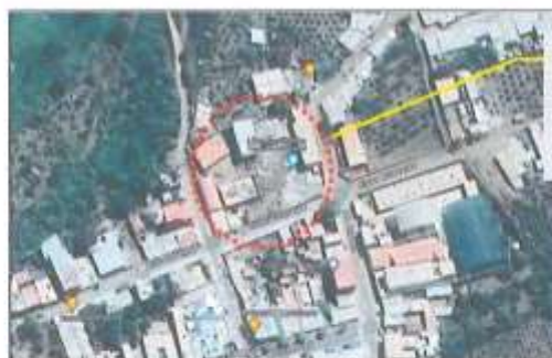
Imagen satelital: Ubicación de la I.E. Agropecuario Yautan