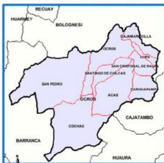
MAPA N° 03: DISTRITO DE COCHAS

REQUERIMIENTOS TÉCNICOS MÍNIMOS PARA LA CONTRATACIÓN DE LA EJECUCIÓN DE LA OBRA: "MEJORAMIENTO DEL SERVICIO DE PROVISIÓN DE AGUA PARA RIEGO EN EL CANAL DE DESAGÜE EN EL SECTOR ESPACHIN Y CONSTRUCCIÓN DE CERCO PERIMETRICO EN EL CANAL LA VEGA OTOPONGO EN LA LOCALIDAD DE ESPACHIN DISTRITO DE COCHAS DE LA PROVINCIA DE OCROS DEL DEPARTAMENTO DE ANCASH" con CUI N° 2636115.