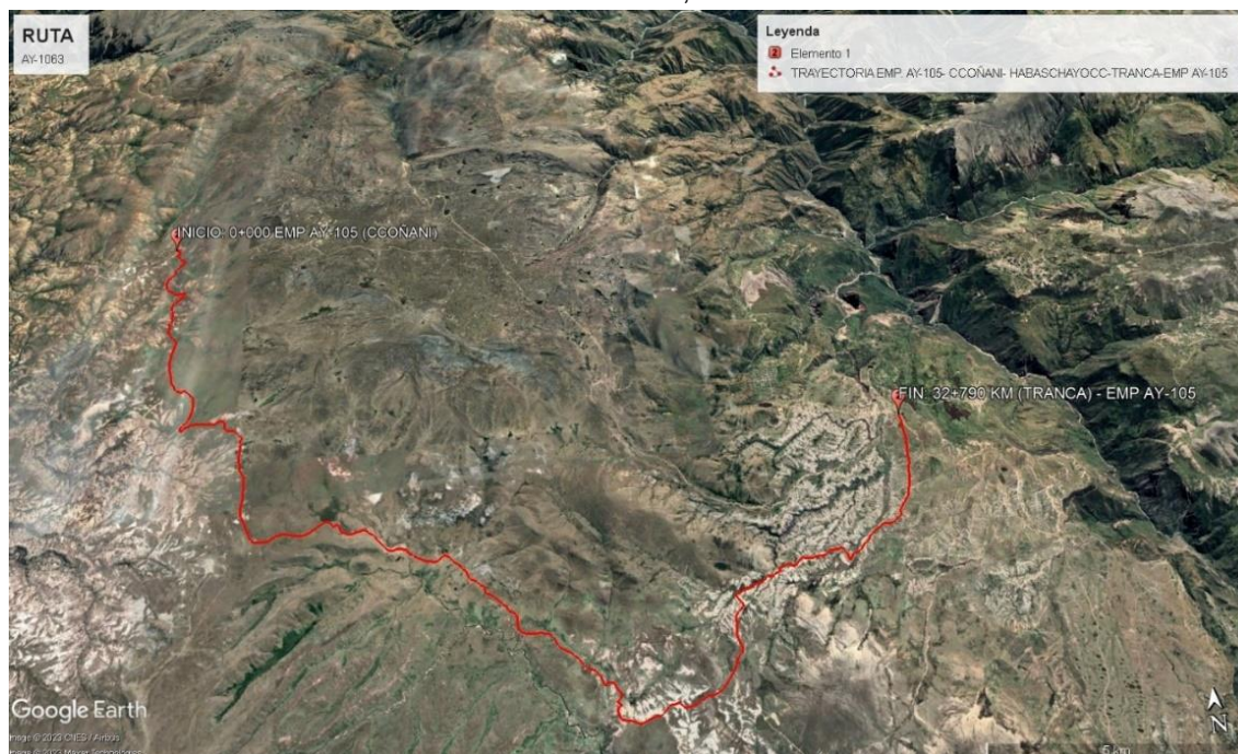
Imagen satelital google heart, de la ubicacion del tramo

DEPARTAMENTO : AYACUCHO PROVINCIA : SUCRE DISTRITO : QUEROBAMBA LOCALIDADES : CCOÑANI – HABASCHAYOCC - TRANCA TRAYECTORIA : EMP. AY-105 – CCOÑANI – HABASCHAYOCC – TRANCA – EMP. AY - 105 RUTA : AY-1063 ZONA : RURAL REGIÓN NATURAL : REGION SIERRA ALTITUD PROMEDIO : 3,897.00 MSNM LONGITUD : 32.790 KM INICIO : N° 8445046.00, E 632318.00 FIN : N° 8438674.00, E. 648565.00