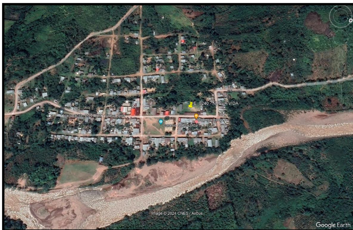
Figura 1: Ubicación de la I.E 0240

JURISDICCION : UGEL HUALLAGA. LOCALIDAD : NUEVA VIDA. DISTRITO : ALTO SAPOSOA. PROVINCIA : HUALLAGA. DEPARTAMENTO : SAN MARTÍN.