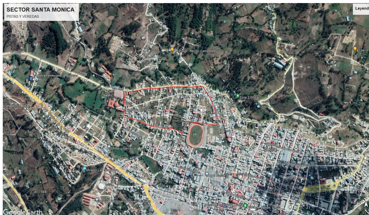
Imagen 2: Ubicación del Proyecto en la Ciudad de Chota