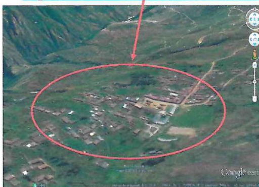
Plano de localización del área de intervención

OBRA: MEJORAMIENTO DE LA TRANSITABILIDAD VEHICULAR Y PEATONAL EN LA LOCALIDAD DE HUAYLLATI, DISTRITO DE HUAYLLATI, GRAU - APURIMAC