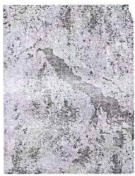
Canal de tierra existente