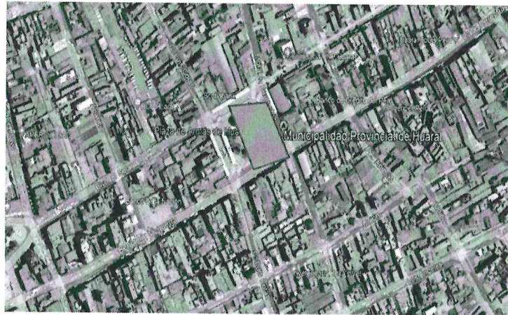
IMAGEN SATELITAL DEL ÁREA DE INTERVENCIÓN

En Huaral, los veranos son calurosos, húmedos, áridos y nublados y los inviernos son largos, cómodos, secos y mayormente despejados. Durante el transcurso del año, la temperatura generalmente varía de 16 °C a 28 °C y rara vez baja a menos de 14 °C o sube a más de 30 °C.