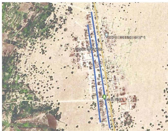
VISTA GOOGLE EARTH A.H. CASERIO MALAVIDA