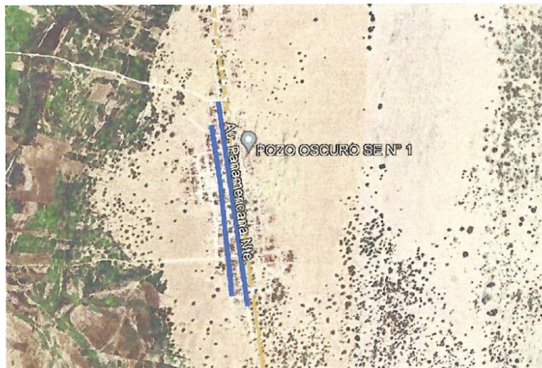
VISTA GOOGLE EARTH A.H. CASERIO MALAVIDA