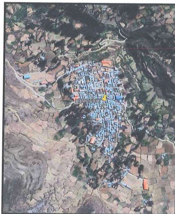
Lugar del proyecto. Google Maps.

El acceso a la localidad de Huacachi desde la ciudad de Huaraz, se encuentra descrita según el cuadro que a continuación de detalla: