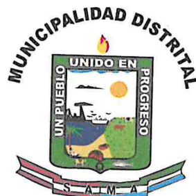
Logo de la Municipalidad Distrital de Sama