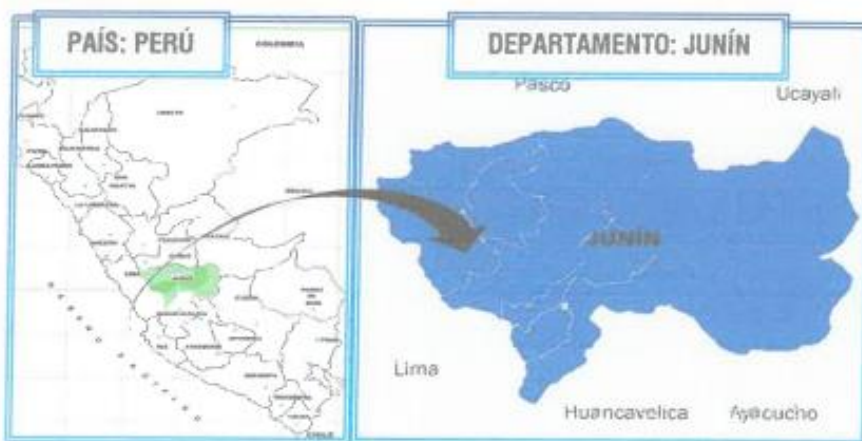
Figura 1. Macro localización.