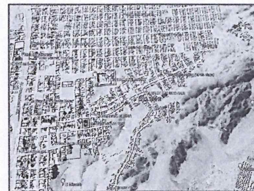
Zona de la ejecución del Proyecto

Para llegar a la zona del proyecto tomando como referencia la ciudad de Lima se tiene que hacer el siguiente recorrido: