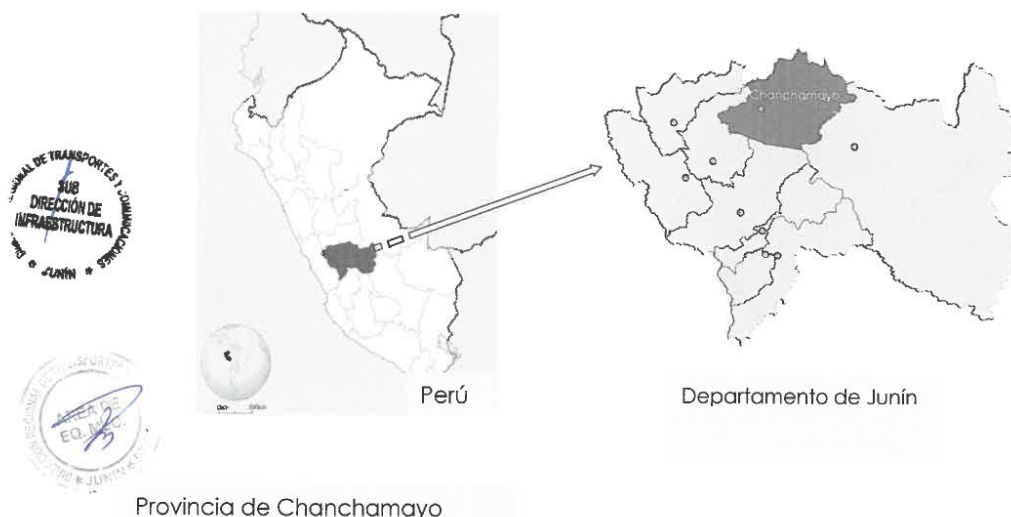
GRAFICO N°01: UBICACIÓN DEL PROYECTO