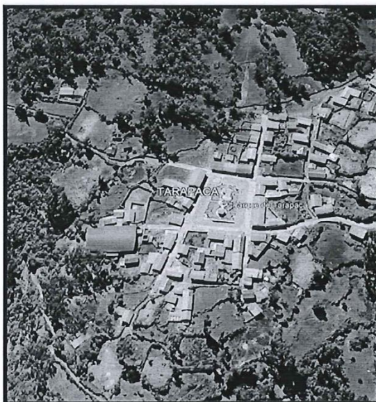
Lugar del proyecto.