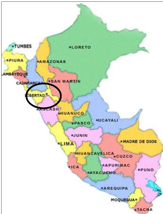
Mapa N° 01: Mapa del Perú

Entidad : Municipalidad Provincial de Pataz Sector : Nuevo Santa Rosa Distrito : Tayabamba Provincia : Pataz Departamento : La Libertad