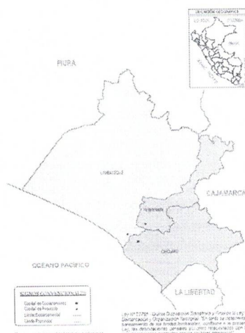
15.1 MAPA DEL DEPARTAMENTO DE LAMBAYEQUE