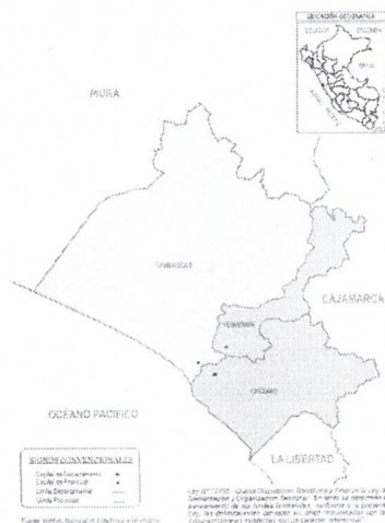
15.1 MAPA DEL DEPARTAMENTO DE LAMBAYEQUE

El integrante del Consorcio B & V Consultores y Ejecutores según RNP según la propuesta (Folio 10) señala como domicilio en Lima – Lima – Santiago de Surco, lo cual la provincia de Lima no es provincia colindante con la Provincia de Ferreñafe. por lo que el consorciado no cumple con dicha bonificación.