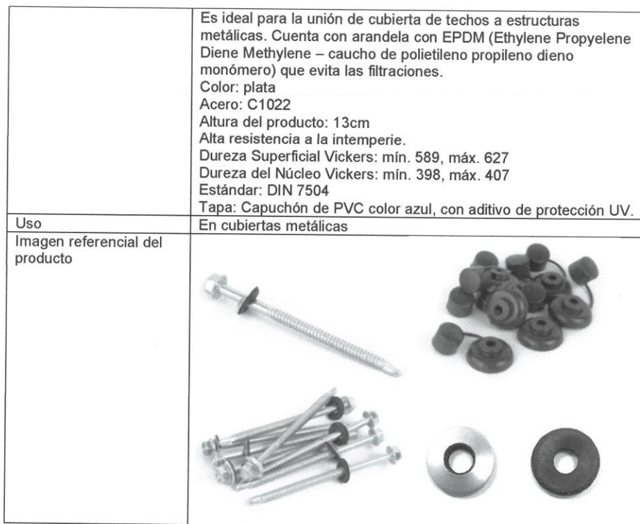
Tabla 09. Capuchón metálico para plancha TAF 1000. COLOR AZUL RAL 5010.