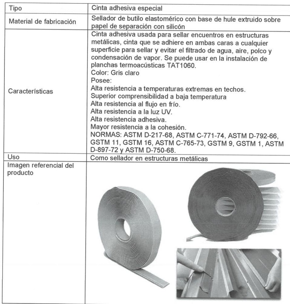
Tabla 11. Cinta Foil BP 60 3/25 x 2 cm rollo de 10m.