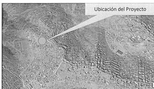
Imagen 1: Ubicación del proyecto en el Distrito de San Juan de Lurigancho.