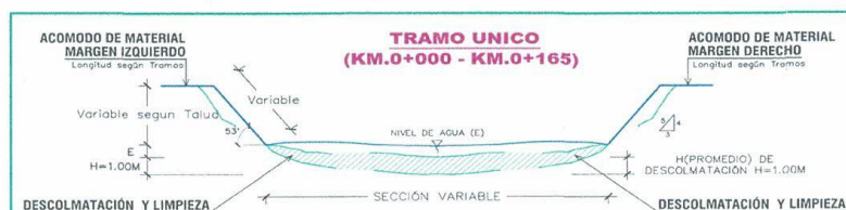
Figura 2: Sección típica de descolmatación.

Luego de haber retirado el material colmatado del río se procederá a colocar dicho volumen en los taludes de esta misma, tanto en el margen derecho como izquierdo, aguas arriba y aguas debajo de la ubicación del puente.