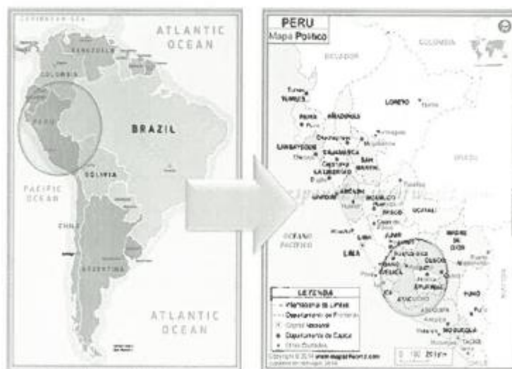
FIGURA N° 01 - MAPA DE UBICACIÓN MACRO