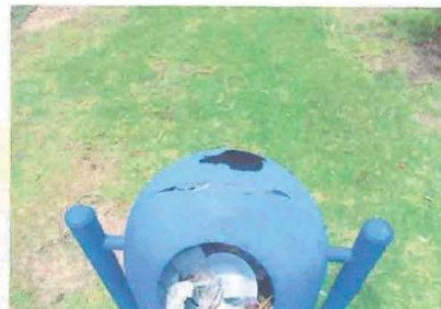
Fotografía N° 02 tachos de basura que requieren reemplazo