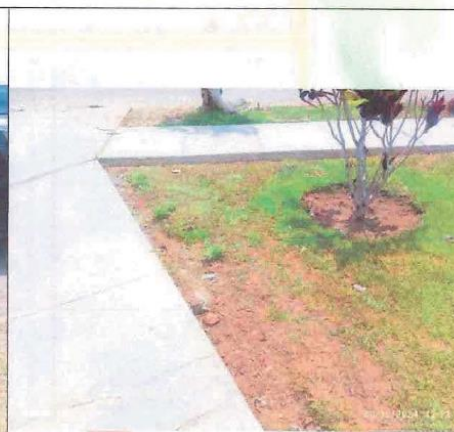
Fotografía N° 04 áreas verdes que requieren mantenimiento.