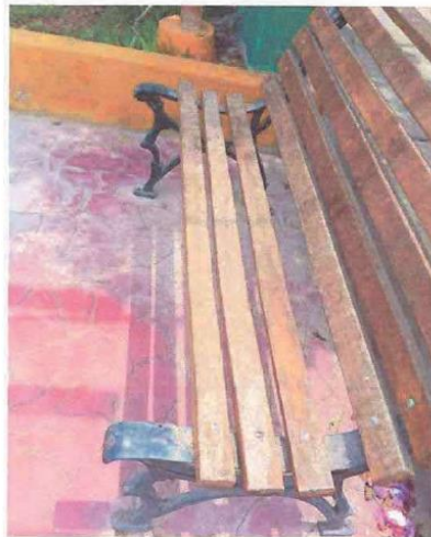
Fotografía N° 01 bancas en mal estado.