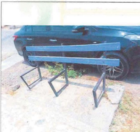
Fotografía N° 03 bancas en pésimo estado.