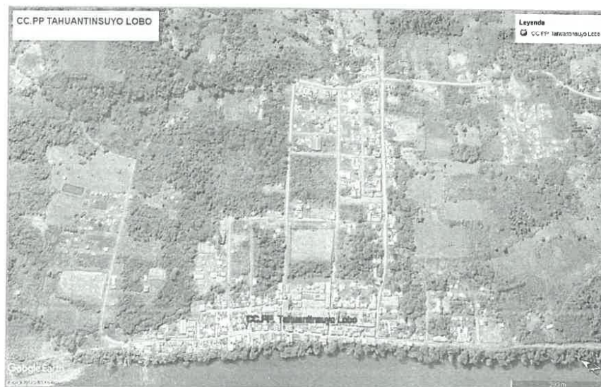
IMAGEN N°1. Ámbito de influencia del proyecto