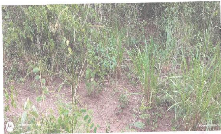
Fotografía N° 3: vista de la vegetación del predio Motelo-Poronguito.