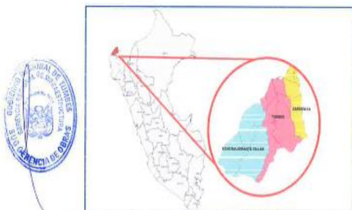
Ilustración: Ubicación del Departamento de Tumbes en el Perú.