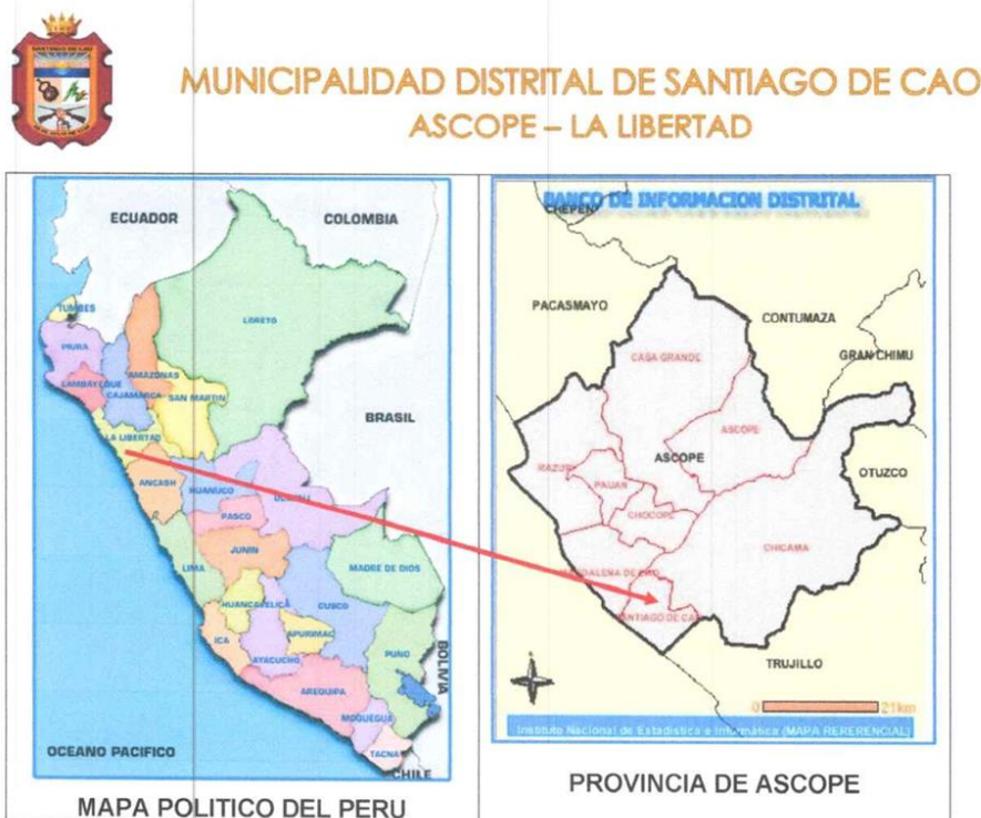
IMAGEN N°02. Mapa Político del Distrito de Santiago de Cao y ubicación satelital del lugar que comprende el proyecto.