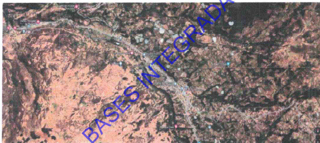
Centro Poblado de VICOS: I.E. 235, nivel Inicial