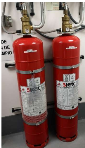
Imagen de los cilindros ubicados en Sala Eléctrica.

Imagen de los cilindros ubicados en Salas de Monitoreo y Servidores.