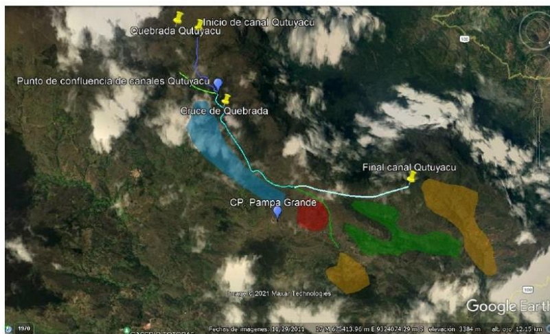
Vistas fotográficas del canal Qutu Yaku.