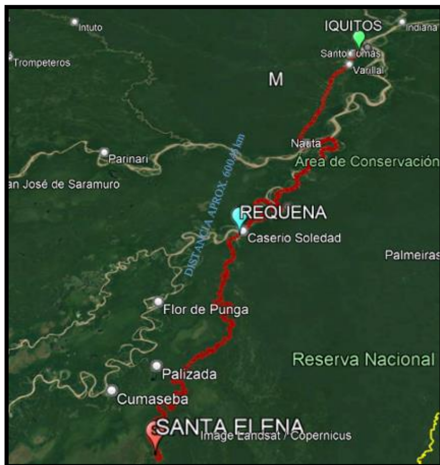
Fig. 04 Imagen Satelital de la Vía de Acceso Iquitos – Santa Elena