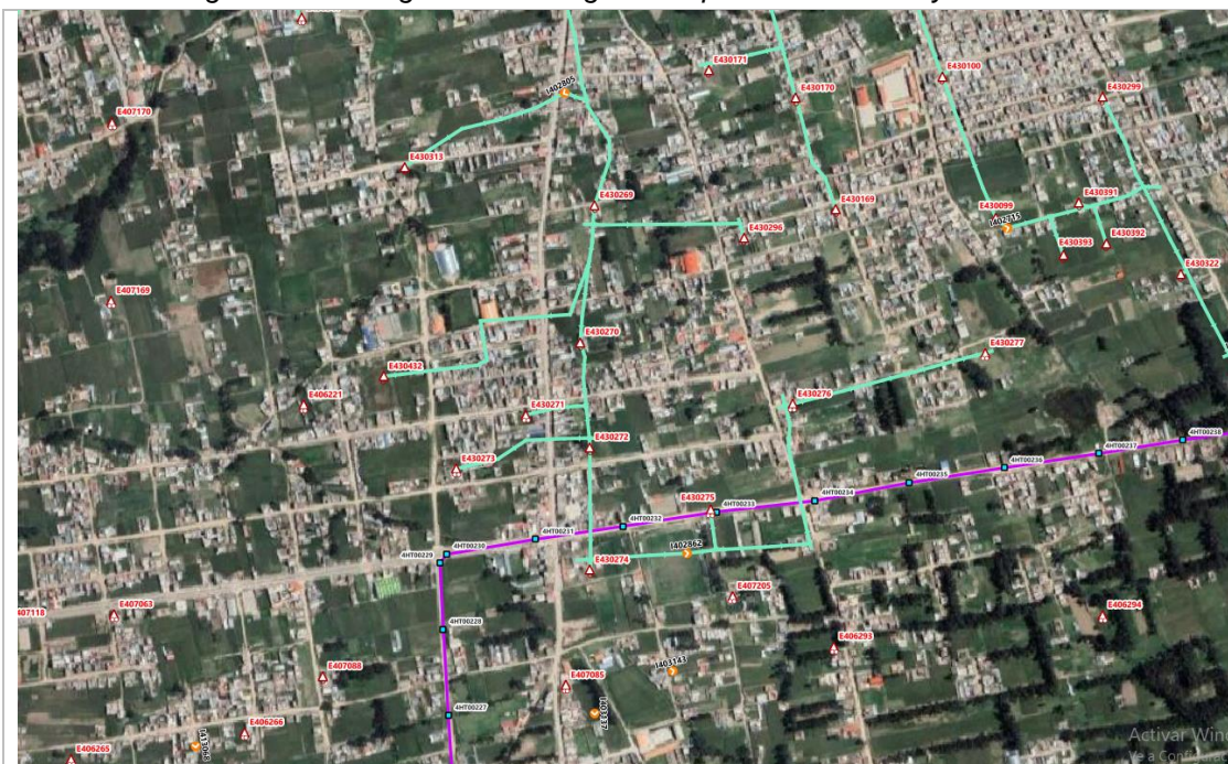
Fig. n.º 2. Fotografías del diagnóstico preliminar del Proyecto

Zona donde se proyecta la instalación de la nueva SET Chilca