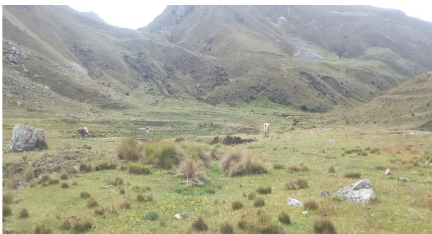
Vista fotografía del vaso Tincopampa