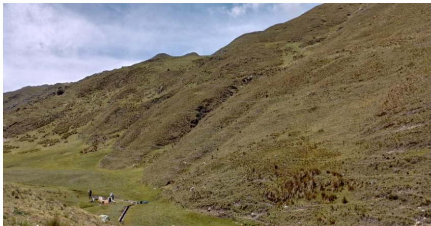
Vista fotografía del vaso Huinacocha

Por las razones antes expuestas y a fin de poder solucionar este problema que aqueja a los pobladores de la localidad en mención se plantea la creación de los servicios de riego.