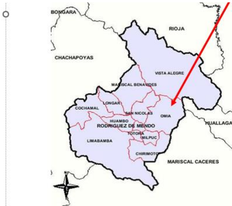
MAPA N° 03: AREA DE INFLUENCIA DEL PROYECTO