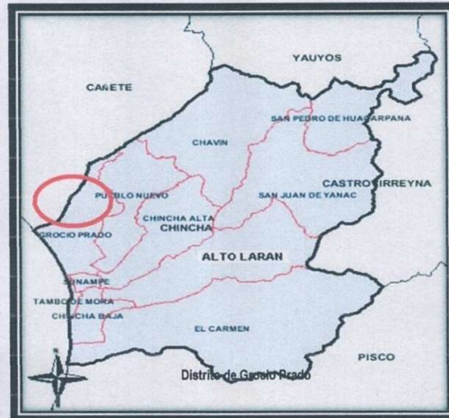
IMAGEN N° 01 – AREA DE INFLUENCIA DEL PROYECTO