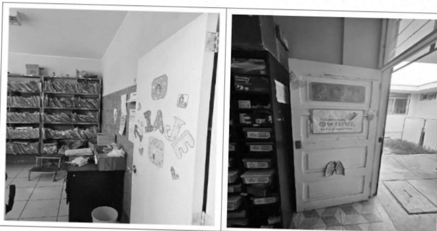
Puertas del Establecimiento en mal estado de conservación

"Año del bicentenario de la consolidación de nuestra Independencia, y de la conmemoración de las heroicas batallas de Junín y Ayacucho"