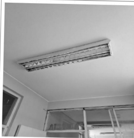
Mantenimiento de Luminarias y Sistema Eléctrico