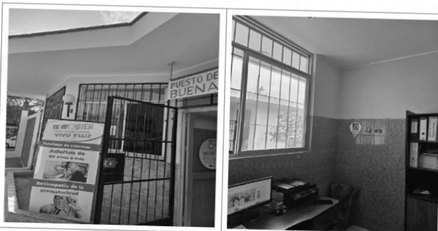
Muros Exteriores e Interiores del Establecimiento en mal estado de conservación