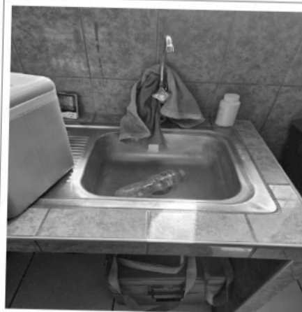
Mantenimiento del Sistema Sanitario