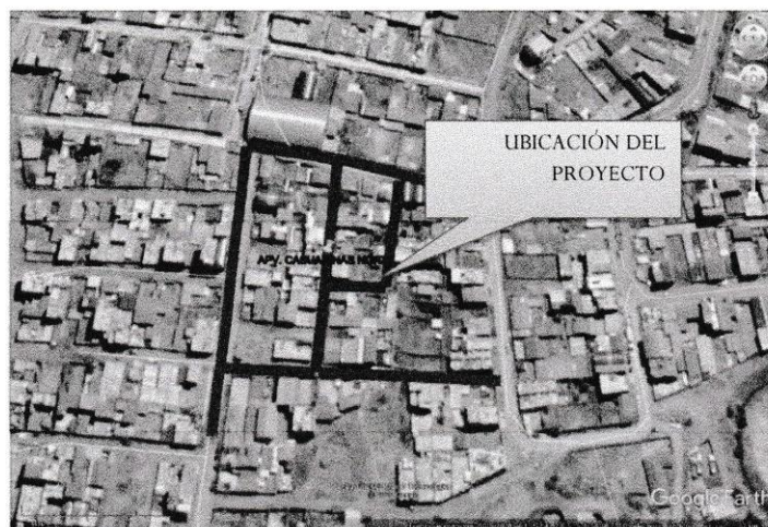
Imagen N°02 Ubicación de las Calles a intervenir

Región : Cusco Provincia : Cusco Distrito : San Jerónimo Sector : APV Casuarinas Norte