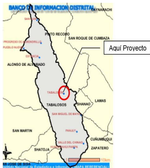
Mapa del Distrito Tabalosos