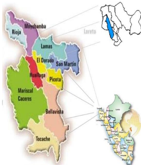
Macro localización de la provincia Lamas