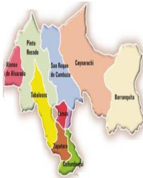
Mapa de la provincia Lamas